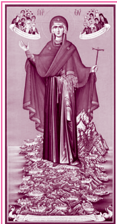
Лиддская икона Божией Матери (на столпе)

к Богу, но Илиодор только смеялся над святителем и не только не старался исправиться, но задумал большее зло: он простер свои волхования на храм Божий. Однажды, когда святой Лев совершал богослужение, в храм вошел Илиодор и начал волховать. Своим искусством он достиг того, что одни молящиеся начали