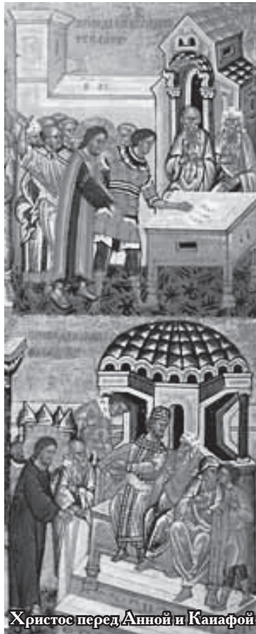
Христос перед Анной и Каиафой

Еврейское судопроизводство было классической