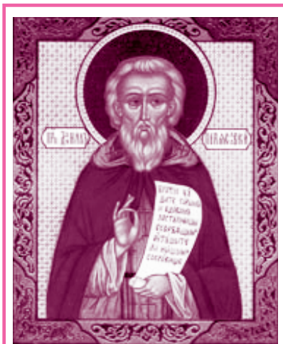
Преподобный Даниил Переяславский

стиан. Вокруг него монахи выстроили себе келии, образовав монастырь, где в 1525 году преподобный Даниил стал настоятелем. Одна из главных заповедей, которую преподавал новый настоятель, призывала принимать всех странников, убогих и нищих. Он вразумлял братию и наставлял на путь истины кротостью и любовью, всем подавая пример чистой жизни и глубокого смирения.