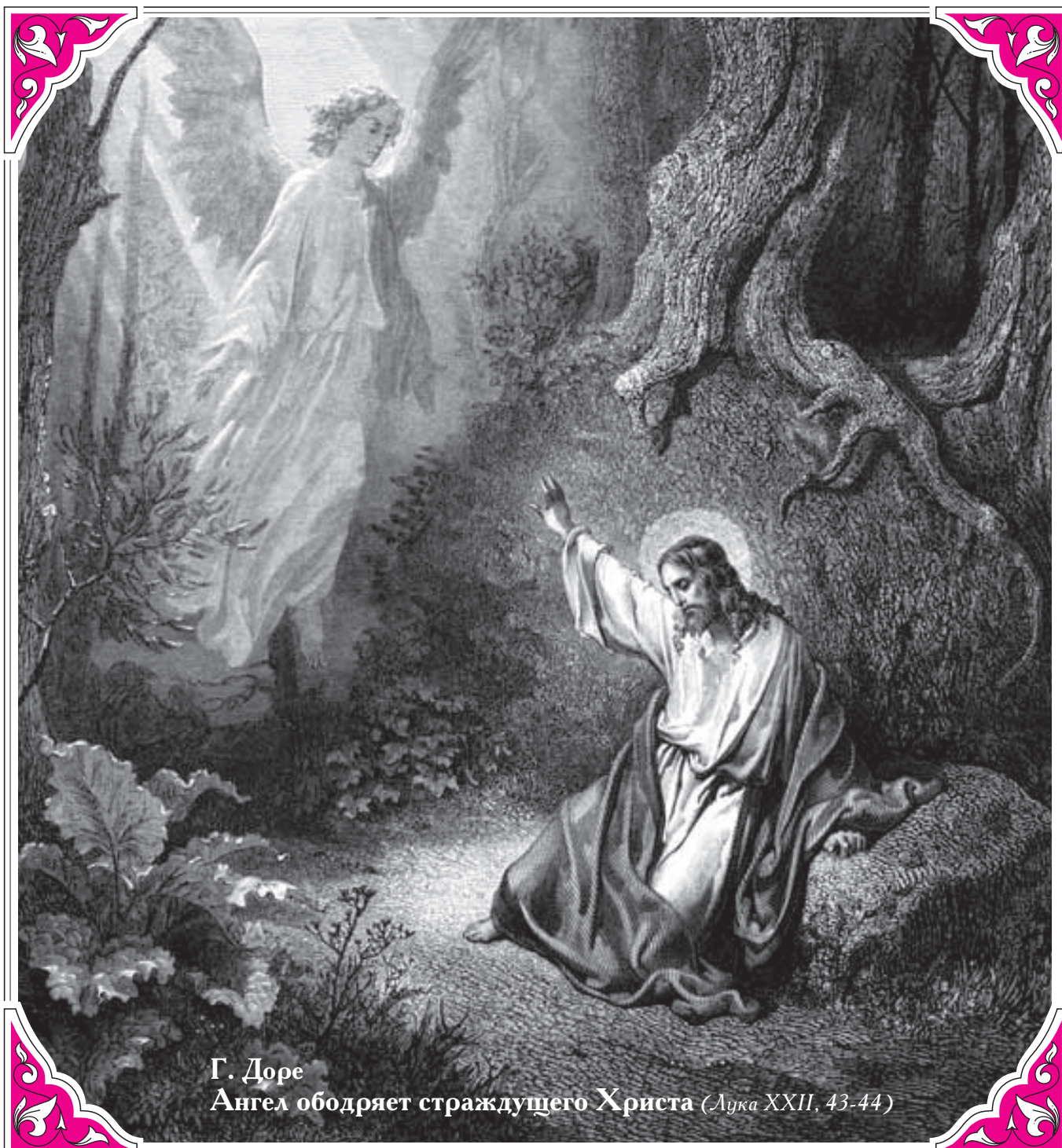
Г. Доре Ангел ободряет страждущего Христа (Лука XXII, 43-44)

Газета Александрo-Невского собора города Барнаула. Печатается по благословению Преосвященнейшего Максима, епископа Барнаульского и Алтайского