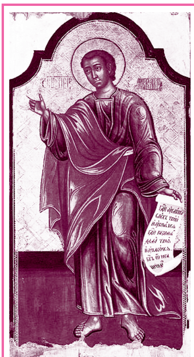
Пророк Аввакум (из 12-ти малых пророков)

в молитвах, раздавая при этом много милостыни. Но диавол, всегда препятствующий людям в подвигах богоугодной жизни, не мог вынести таковых добродетелей святой девы и вложил одному юноше нечистое желание к ней.