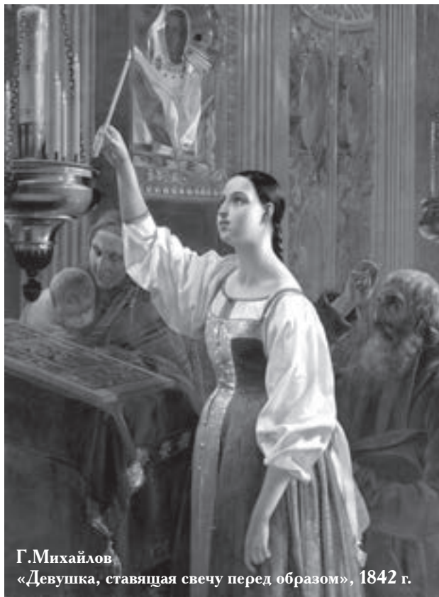
Г. Михайлов «Девушка, ставящая свечу перед образом», 1842 г.

Намучившись неизвестностью, опять пришла к отцу с тем же вопросом: «Только одно слово, батюшка! Иначе со мной будет плохо». Отец внимательно посмотрел на неё и на этот раз осерчал не очень: «Для тебя он