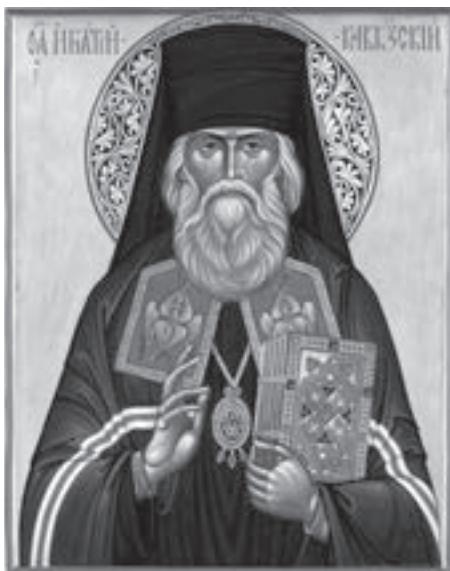
Святитель Игнатий (Брянчанинов)

Этого отречения требует от тебя Господь, законоположитель любви не с тем, чтоб лишить тебя любви и любимых, но чтоб ты, отвергнув любовь плотскую, оскверненную примесью греха, соделался способным