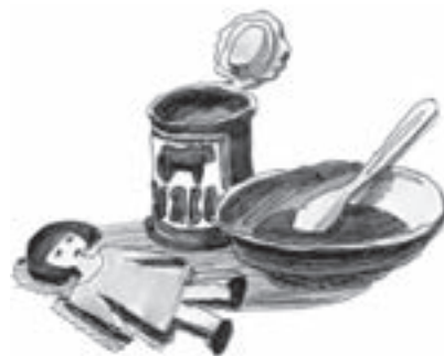
Рис. Ш. Ворошилова