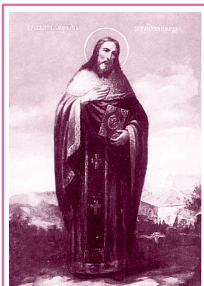
Преподобный Сампсон Странноприимец

Случилось так, что император византийский Юстиниан I (527-565 гг.) тяжело заболел. Не получив облегчения от помощи самых искусных придворных