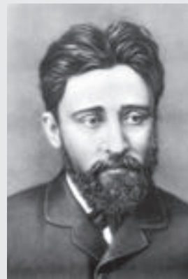
Гаршин Всеволод Михайлович (1855-1888), — известный русский писатель.

— Господин мой, скажи мне, чем я прогневала тебя, что ты удалил от себя жену