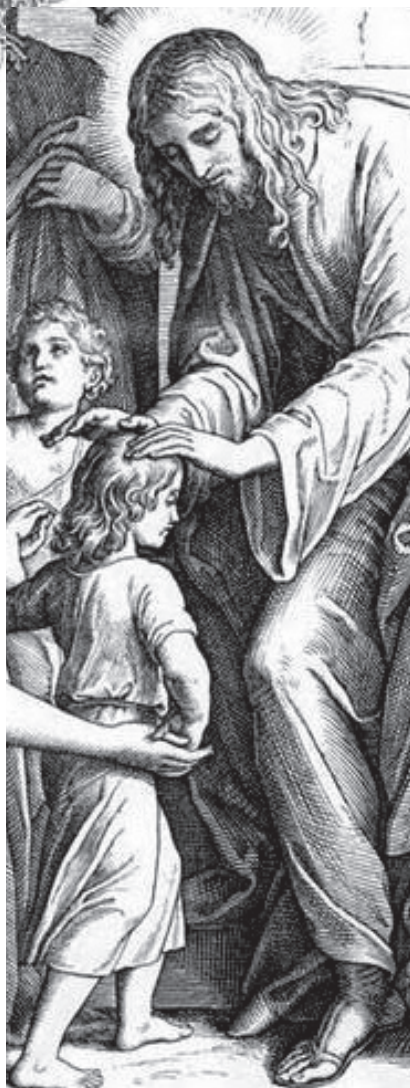
Свт. Иоанн Златоуст

Считай себя царем, имеющим подчиненный тебе город — душу ребенка, ибо душа, действительно, город. И подобно тому, как в городе одни воруют, а другие ведут себя честно, одни трудятся, а другие занимаются тем, что попадает под руку, так же ведут себя в душе рассудок и помыслы: одни сражаются против преступников, как в городе воины, другие заботятся обо всем, что относится к телу и к дому, как граждане в городах, третьи же отдают приказанья, как городские власти.