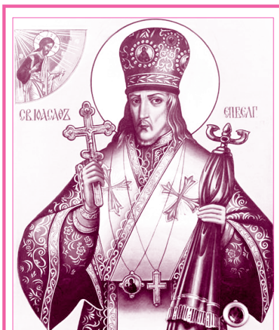
Святитель Иоасаф Белгородский

После этого святой мученик Варлаам предал свою душу Господу (304 г.).