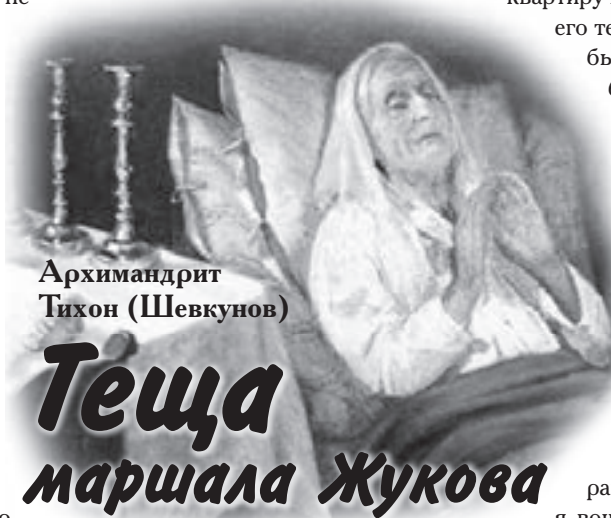
Архимандрит Тихон (Шевкунов)