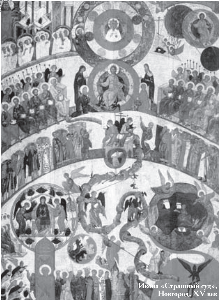
Икона «Страшный суд», Новгород, XV век

А постол Павел писал: человеку положено однажды умереть, а потом суд (Евр. 9:27). В своей заботе о спасении каждого Церковь и предлагает воспоминания об этом суде, чтобы спасти по крайней мере некоторых (1 Кор. 9:22).