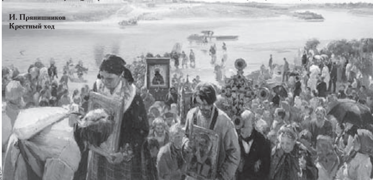
И. Прянишников Крестный ход