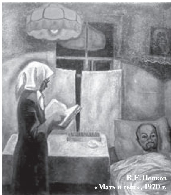
В.Е. Попков «Мать и сын», 1970 г.

Еще более важным нам кажется комментарий И.Н. Крамского к картине «Полесовщик» в письме к П.М. Третьякову: «Мой этюд в простреленной шапке по замыслу должен был изображать один из тех типов (они есть в русском народе), которые много из социального