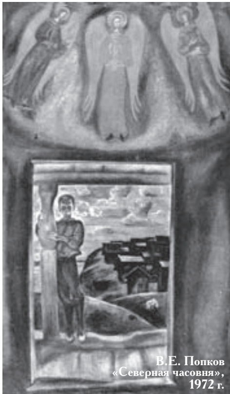
В.Е. Попков «Северная часовня», 1972 г.

А Матвей снова наедине со своими думами и сомнениями. С вопросом: куда же пританцует деревня? — он идет к вдохновителю Кольки — деревенскому интеллигенту Вениамину Захаровичу. Но напрасно ждет серьезного разговора Матвей. Захарыч отвечает, что человек себя всегда прокормит, но ведь главное: надо еще «песню спеть», «черта с рогами выдумать»... Старый председатель понимает: интеллигенция тоже пленена нечистым духом. Мало того, что интеллигенция сама бесплодна (у Захарыча ни семьи, ни детей), интеллигенция снова толкает народ к гибели. Вениамин Захарович рассказывает мужикам о Стеньке Разине: «Бывало, как развернется, как глянет исподлобья... травы никли... Но справедливым был». Советская мифология льется из уст Захарыча. Важная деталь: вождь Степан насильно кормит своим куском конины голодного воина-казака. Причем Стенька даже обнажает саблю, чтобы заставить воина съесть мясо. Конина для русского человека — нечистая еда, а благом и добром считается — поделиться куском хлеба. Даже советской мифологии вожди принимали от народа