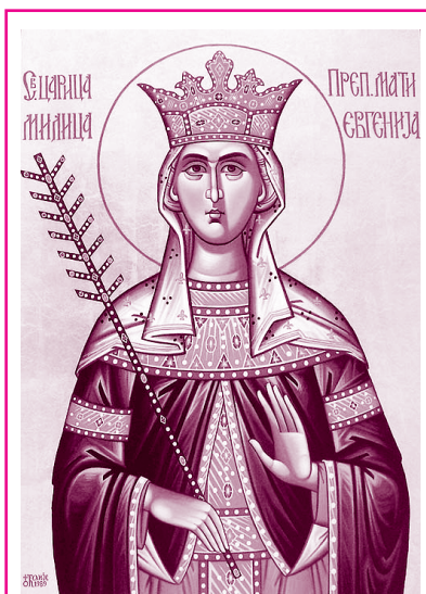
Святая Миллица, княжна Сербская

Святых мучеников Марина, Марфы и иных многих с ними в Риме (19/6 июля)