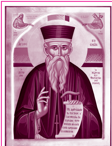
Равноапостольный, Косма Этолийский

миться не в господские дома, не ко двору вельмож и не для богатства и знаменитости расточать свою ученость, но, чтобы приобрести небесную награду и неувядающую славу, более всего должны учить простой народ, живущий в великом невежестве и