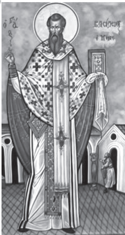
Святитель Василий Великий