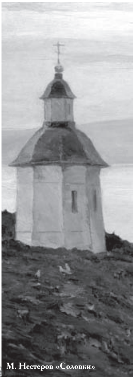
М. Нестеров «Соловки»

Так случилось и на сей раз, когда В.И. извлёк с полки папку, где лежало несколько изрядно помятых и загрязнённых листков, вырванных из школьной тетрадки в косую линейку и исписанных выцветшими от времени и расплывшимися чернилами. По его словам, он обнаружил их случайно, в мусорной куче на месте снесённого старого дома. По некоторым сведениям, содержащимся в записях, В.И. приблизительно датировал их концом шестидесятых годов. С первых же строк я поняла, что с ними стоит ознакомить и вас. Поэтому, с разрешения В.И., ниже я привожу их текст почти целиком.