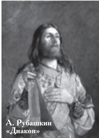
А. Рубашкин «Диакон»

Все они называются священнослужителями, потому что через таинство священства они получают благодать Святого Духа для священного служения Церкви Христовой; совершать богослужения, учить людей христианской вере и доброй жизни (благочестию) и управлять церковными делами.