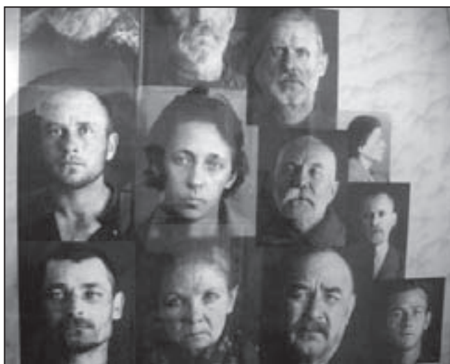
Лица людей, сфотографированных перед расстрелом. Те, кто на них смотрит, говорят: «Не лица, а лики»

Беседовал Александр Филиппов Православие и мир