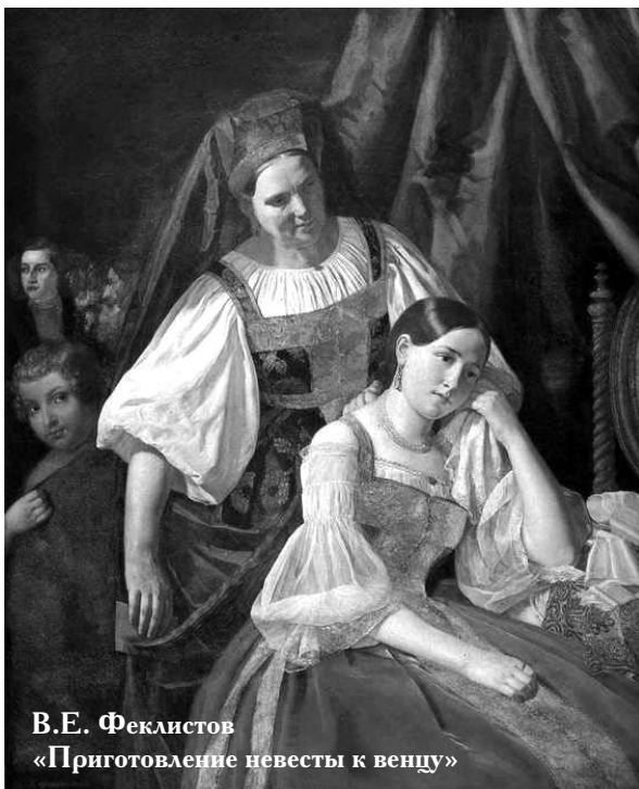
В.Е. Феклистов «Приготовление невесты к венцу»

Итак, эта приверженность к моему, твоему и чьему бы то ни было — поистине большое искушение в браке, это разрушительный фактор, и преодолевается это через общую собственность, через общее пользование вещами с преодолением нашей привязанности к тому, что мы считаем своим, — месту, времени, мнению. Я знаю супругов, которые ругаются из-за футбольной команды. Да. Ругаются из-за партии, из-за уймы других вещей, и один не соглашается с другим. Всё это — проявления сребролюбия, этой страсти, всеобъемлющей страсти, которая отсекает надежду. Кто отсекает свою надежду на Бога, того охватывает стресс, тот изнуряет себя, переутомляется.