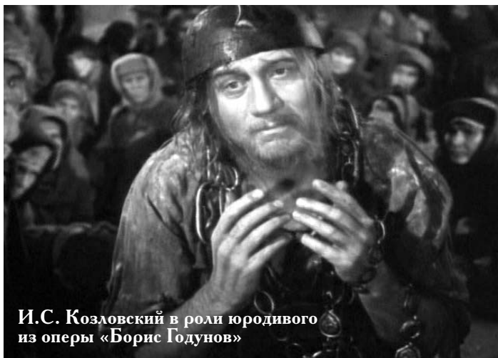
И.С. Козловский в роли юродивого из оперы «Борис Годунов»