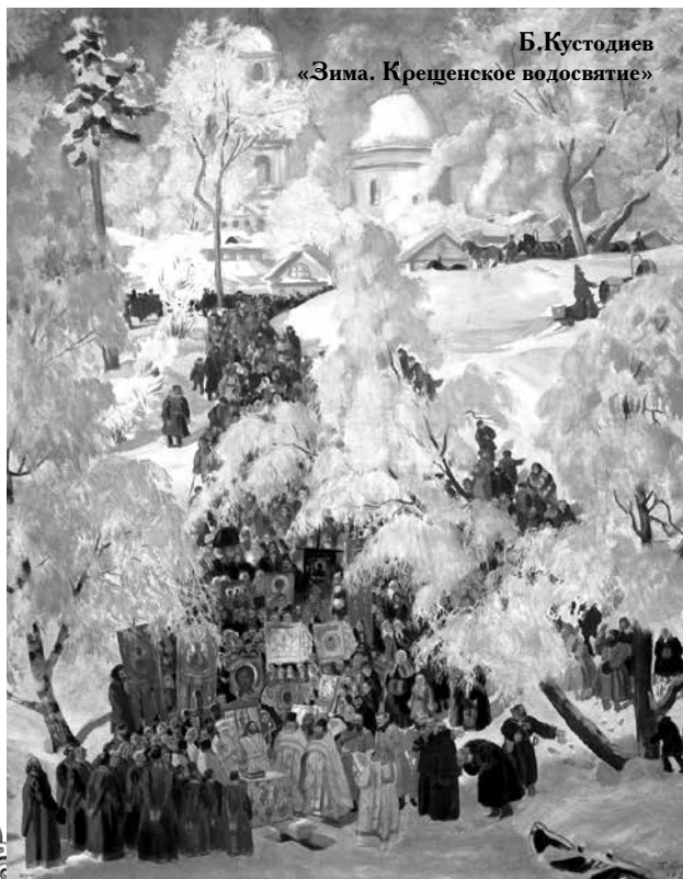
Б. Кустодиев «Зима. Крещенское водосвятие»