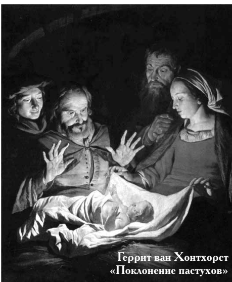
Геррит ван Хонтхорст «Поклонение пастухов»

Святой Кирилл Александрийский много размышлял над этим Божественным «кенозисом», над этим уничижением. «Бог — говорит он, — воплощаясь, не мог совлечь с Себя Своей природы, ибо тогда Он не был бы больше Богом, и нельзя было бы говорить о воплощении. А это значит, что субъектом кенозиса является не природа, а Личность Сына. Личность же «совершается» в отдаче Себя: она отличается от природы не для того, чтобы «превозноситься» естественным, а чтобы от Себя всецело отказаться; вот отчего Сын «не почитал хищением быть равным Богу», но, напротив, «Сам уничижил Себя», что является не внезапным решением, не единичным актом, но проявлением самого Его существа как Личности; и это также не собственная Его воля, а сама ипостасная Его реальность, как выражение воли троичной, той воли, источник которой — Отец, послушное исполнение которой — Сын, славное завершение — Дух. Итак, существует глубокая неразрывность между личностным бытием Сына, как самоотказом, и Его земным кенозисом. Оставляя пребывание в славе, которой Он никогда не «превозносился», Сын