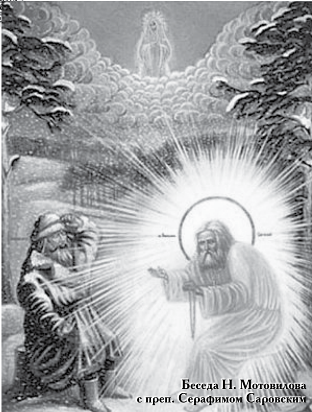
Беседа Н. Мотовилова с преп. Серафимом Саровским

смиримся и покаемся. Это, возлюбленные братья, ключ к тайне благодати Божией. Бог посещает смиренного человека, который кается, пусть он пока еще борется с грехами. Однако Бог гнушается гордым человеком, пусть он даже и будет безупречен во всем остальном. Бог гнушается горделивым человеком и не только не помогает ему, не только не хочет его, но и отверщается от него, как говорится в Писании. Он мерзость пред Богом.