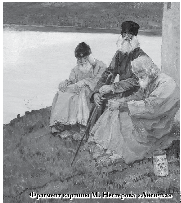
Фрагмент картины М. Несторова «Лисичка»

И я говорю это не для того, чтобы судить и осуждать других людей, а чтобы мы видели себя, когда идем пред