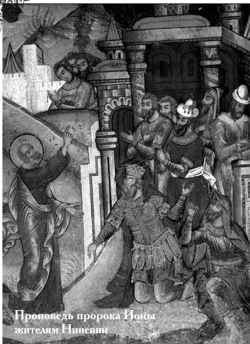
Проповедь пророка Ионы жителям Ниневии

О как верно называют священные песнопения пост матерью целомудрия, ибо ничто не располагает так к нарушению целомудрия, как объедение и пьянство.