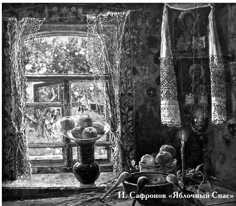
И. Сафронов «Яблочный Спас»