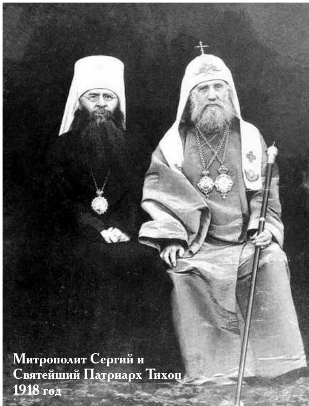
Митрополит Сергей и Святейший Патриарх Тихон 1918 год

Сталин проводил гостей до дверей своего кабинета, а митрополита Сергия, взяв «под руку, осторожно, как настоящий иподиакон, свел по лестнице вниз и сказал на прощание: «Владыко! Это всё, что я могу в настоящее время сделать для вас!».