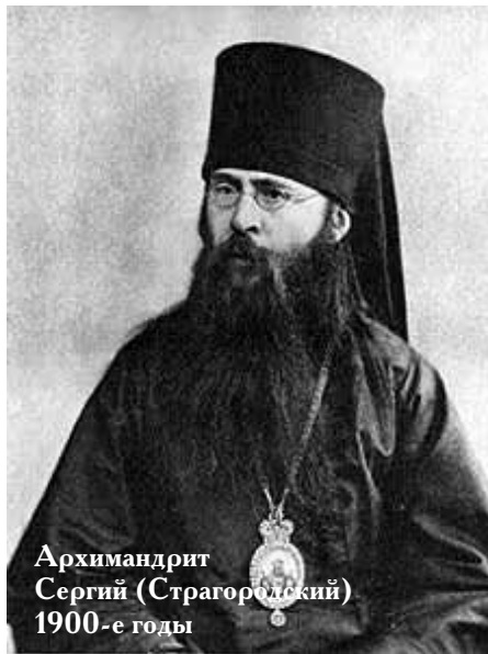
Архимандрит Сергий (Страгородский) 1900-е годы

В 1905 году церковные служители с тревогой ожидали выхода правительственного указа о веротерпимости. Понимал, что это принесет Церкви и владыка Сергий. Множество сект и вероучений хлынет на Русь с Запада, увлекая в свои сети нетвердых в вере людей. Однако на приближавшуюся брань он смотрел как на путь к победе, которую Святая Церковь непременно должна одержать. «Христиане первых веков, — говорил владыка в одном из своих обращений к пастве, — знали, что царство зла открыто и нагло восстанет на царство Божие и будет воевать на Церковь Христову, что многие не выдержат этого огненного искушения и погибнут в водовороте соблазна. Зная все это, христиане первых веков отнюдь не содрогались пред грядущими ужасами... Так же радостно и бодро, с такою же уверенностью в победе и с такою же готовностью принести Христу и Его Церкви все свои силы и способности должны ожидать и сыны Православной Русской Церкви грядущее на нее испытание. В дальнейшем потребуют от нас уже не красных фраз и не заученных