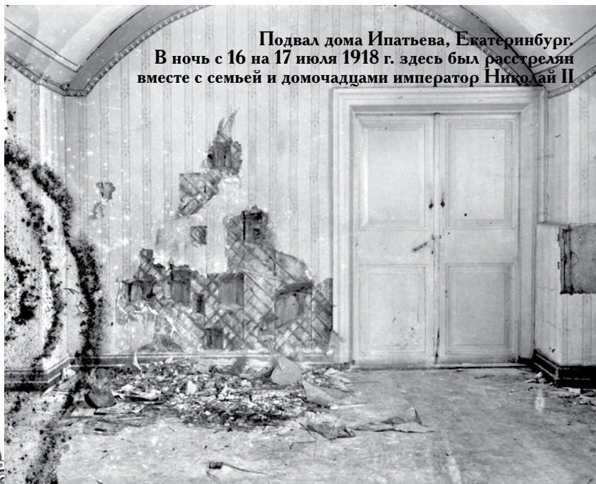
Подвал дома Ипатьева, Екатеринбург. В ночь с 16 на 17 июля 1918 г. здесь был расстрелян вместе с семьей и домочадцами император Николай II

Думаю, если отнестись со вниманием, серьезно, то нельзя не почувствовать, не увидеть величие этого подвига и не быть очарованным этими чудными образами — государя, государыни и их детей. Их жизнь была полна трудностей, скорбей, но была прекрасна! В какой строго-