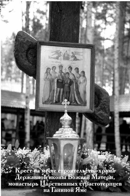
Крест на месте строительства храма Державной иконы Божией Матери, монастырь Царственных страстотерпцев на Ганиной Яме

сти воспитывались дети, как они все умели трудиться! Как не любоваться поразительной духовной чистотой великих княжон! Современным молодым людям нужно увидеть жизнь этих царевен, столь они были просты, величественны и прекрасны. За одно только целомудрие можно было их уже канонизировать, за их кротость, скромность, готовность служить, за их любвеобильные сердца и милосердие. Они ведь были очень скромными людьми, непритязательными, никогда не стремились к славе, жили так, как их Бог поставил, в тех условиях, в которые они были поставлены. И во всем отличались удивительной скромностью, послушанием. Никто никогда не слышал, чтобы они проявляли какие-либо страстные черты характера. Наоборот, в них было возвращено христианское устройство сердца — мирное, целомудренное. Достаточно даже просто посмотреть фотографии царской семьи, они сами по себе уже являют удивительный внутренний облик — и государя, и государыни, и великих княжон, и царевича Алексея. Дело не только в воспитании, но и в самой их жизни, которая соответствовала их вере, молитве. Они были настоящими православными людьми: как верили, так и жили, как думали, так и поступали. Но есть поговорка: «Конец венчает дело». «В чем застану, в том и сужу» — говорит Священное Писание от лица Бога.