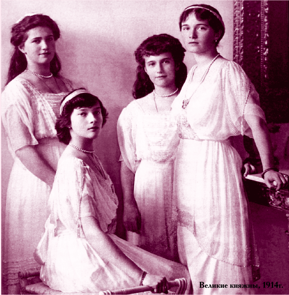
Великне княжны, 1914г.

Среди малоизвестных стихотворений С.Есенина есть одно, обращенное к царевнам, дочерям государя императора Николая II. В 1917 году С.Есенин служил санитаром в Царскосельском полевом военно-санитарном поезде №143, читал стихи в Царскосельском лазарете, где часто бывали императрица и её дочери. Поэт был поражён добротой души, заботой царевен, которые стремились облегчить участь раненых. 22 июля 1916 года С.Есенин был приглашен прочесть стихи Императрице Александре Феодоровне, Цесаревичу Алексию и Великим Княжнам в Царском Селе. Поэт преподнес Великим Княжнам свое новое стихотворение «Младым царевнам», выписав его на большом листе ватмана славянской вязью и украсив орнаментом. После революции стихотворение попало под запрет и было опубликовано лишь в 1960 г. Можно только удивляться прозорливым предвидением С.Есенина трагической гибели «младших царевен», за которых он просил помолиться «святую Магдалину».