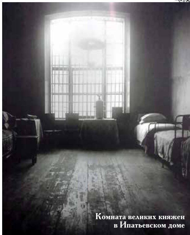
Комната великих княжен в Ипатьевском доме

— Что можно ответить на такое заявление: