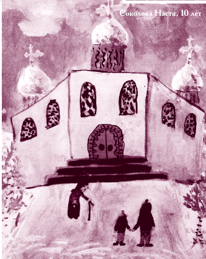
Соколова Настя, 10 лет