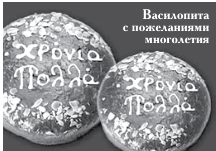
Василопита с пожеланиями многолетия

Монетку до сих пор кладут и всегда проверяют, кто будет счастливым в следующем году.