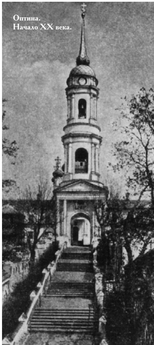
Оптина. Начало XX века.

А ребенком он мог назвать себя, поскольку идеальный христианин становится действительно подобным дитяти по духу. Сам Господь сказал ученикам при благословении детей: «Если... не будете как дети, не войдете в Царство Небесное» (Мф.18:3).