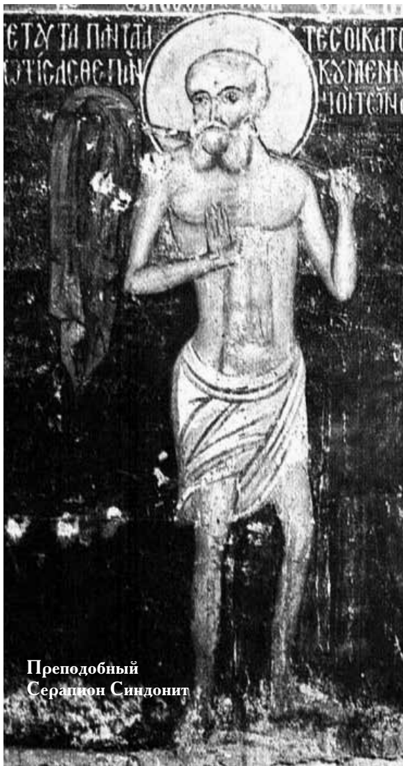
Преподобный Серапион Синдонит