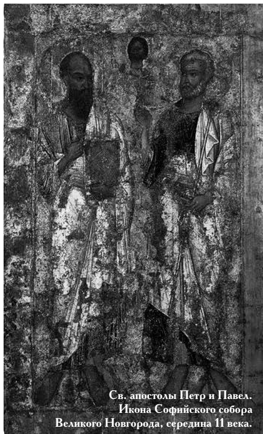
Св. апостолы Петр и Павел. Икона Софийского собора Великого Новгорода, середина 11 века.