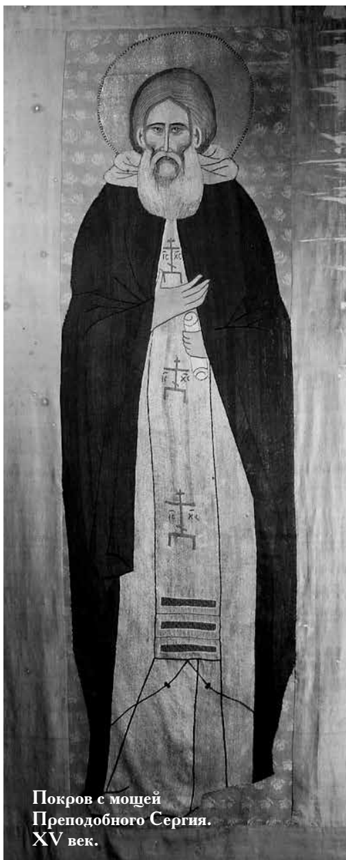
Покров с мощей Преподобного Сергия. XV век.