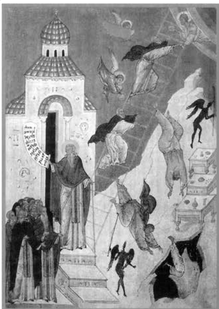
ПРЕПОДОБНЫЙ ИОАНН ЛЕСТВИЧНИК