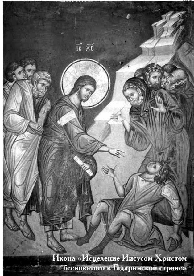
Икона «Исцеление Иисусом Христом бесноватого в Гадаринской стране»

Однажды пришел ко мне человек и сказал мне такое.