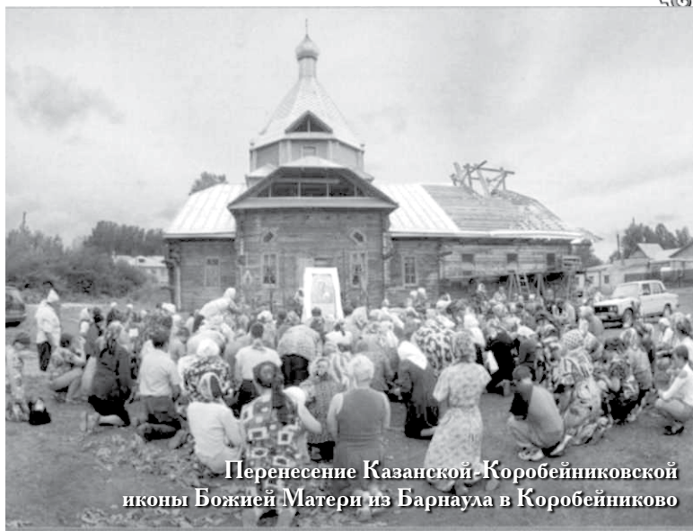
Перенесение Казанской-Коробейниковской иконы Божией Матери из Барнаула в Коробейниково

В 1995 г. в епархии появился свой постоянный печатный вестник — газета «Алтайская миссия». В Бийске в 1995 г. появилась Библиотека православного христианина, а в 1996 г. была открыта православная