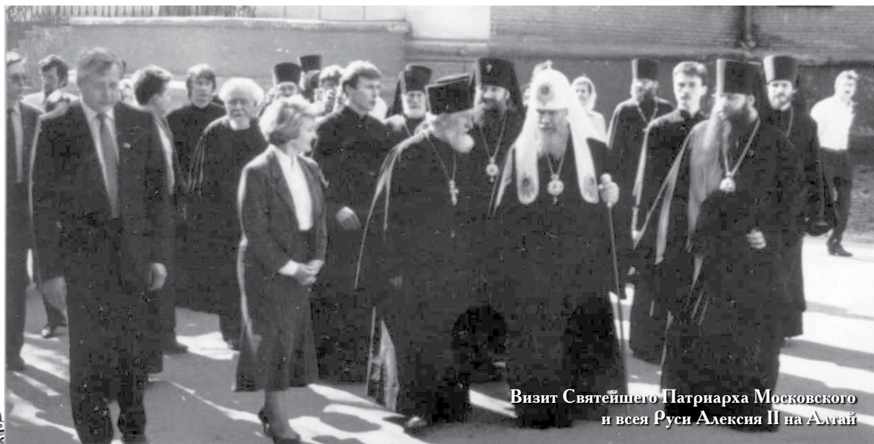
Визит Святейшего Патриарха Московского и всея Руси Алексия II на Алтай

По страницам книги «Барнаульская епархия: 20 лет возрождения»