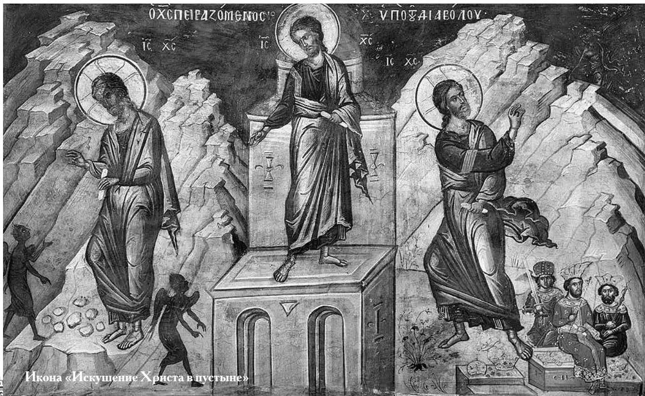
Икона «Искушение Христа в пустыне»

Смелость — очень сильная и важная вещь, она — сила души, которую человек должен иметь. Бог говорит, что боязливые даже не войдут в Царство Божие. Это описывается в Откровении: в одном ряду с ворами, с теми, кто занимается магией, и т. д., находятся и боязливые, потому что страх — признак неверия. У боязливого человека имеются проблемы с верой. Сильный силен не потому, что он верит в себя, не потому, что говорит: «Я сильный, я герой и сделаю всё!» Не так в Церкви, но: «Я сделаю всё силой Божией! Да, я сделаю всё: буду подвизаться, бороться, умру, но через Христа, Ко-