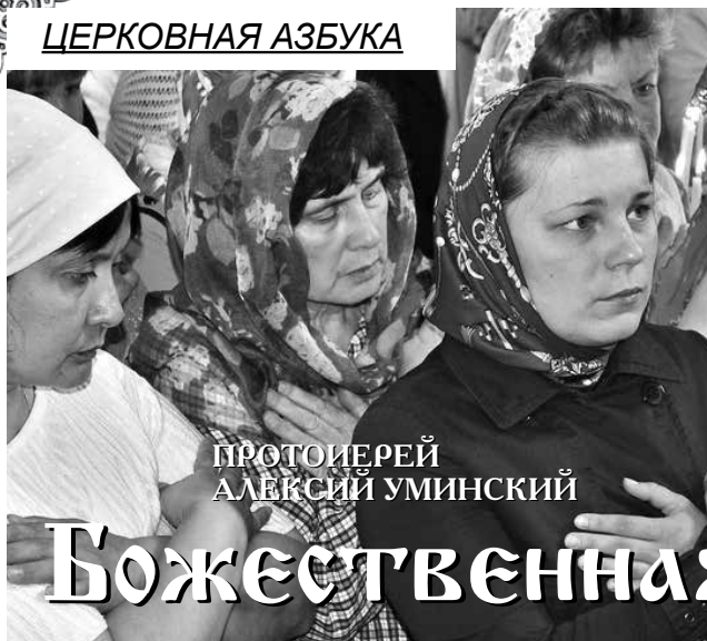
ПРОТОИЕРЕЙ АЛЕКСИЙ УМИНСКИЙ