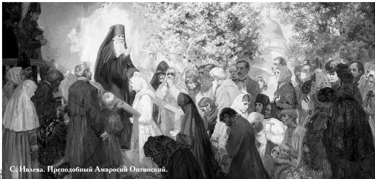
С. Ивлева. Преподобный Амвросий Оптинский.

По страницам книги «Старец Амвросий. Праведник нашего времени»