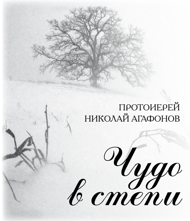
ПРОТОИЕРЕЙ НИКОЛАЙ АГАФОНОВ

— Все, отец Николай, кажется, мы с вами, что называй-