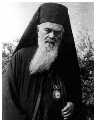
Святитель Николай (Велимирович) (1880-1956) — епископ, богослов и религиозный философ, почетный доктор нескольких мировых университетов