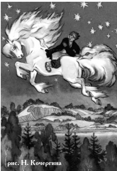
рис. Н. Кочергина

его прозы, поэзии и даже сказки «Конёк-горбунок» невозможно представить вне религиозной сферы, вне отношения писателя к Православию. Очень значимыми образами произведений Ершова, особенно его лирики, являются образы «райской обители», «небесной обители», «небесного света», «светлого мира упования», прекрасных ангелов — херувима и серафима, Божьего храма — «Господнего дома», «святого креста», «святой веры», «тёплой молитвы» и образ Бога, для которого поэт находит множество имён и определений: «Всеблагий Творец», «Создатель мой», «Отец Небесный», «Учитель Вселенной», «Царь Вселенной», «Творец спасенья», «Царь веков», «Отец людей любвеобильный».