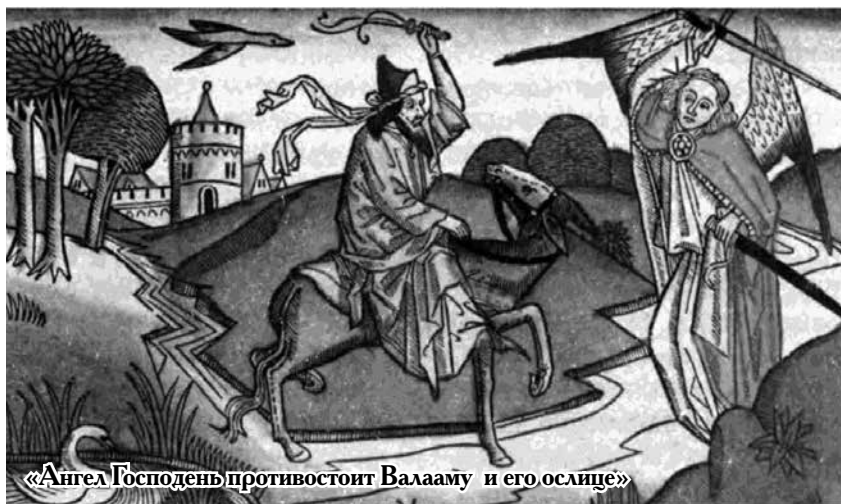
«Ангел Господень противостоят Валааму и его ослице»

Н ет числа средствам и способам, которые использует Господь в управлении судьбы человека к добру. Иногда растения, камни и животные служат орудиями Божьего Промысла.